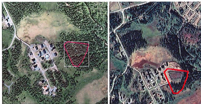
TV: Fastighetskarta – Avasjö 1:635 (markeras med rosa). TH: Utdrag från Google maps 2021-01-14. Fastigheten Avasjö 1:635 markeras ungefärligt med rött.