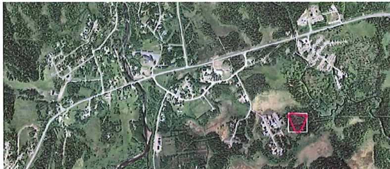
Översiktskarta Borgafjäll. Fastigheten Avasjö 1:635 (markeras med rosa).